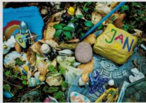
Links und rechts unten: Der Friedhof sieht aus wie ein Märchenwald. Rechts oben: Im Erdgeschoss werden die Leichen eingesargt.

› meistens ihr Baby auf dem Arm, wenn sie durch das Bestattungshaus läuft, es kam elf Tage nach dem Tod ihres Vaters per Kaiserschnitt auf die Welt.