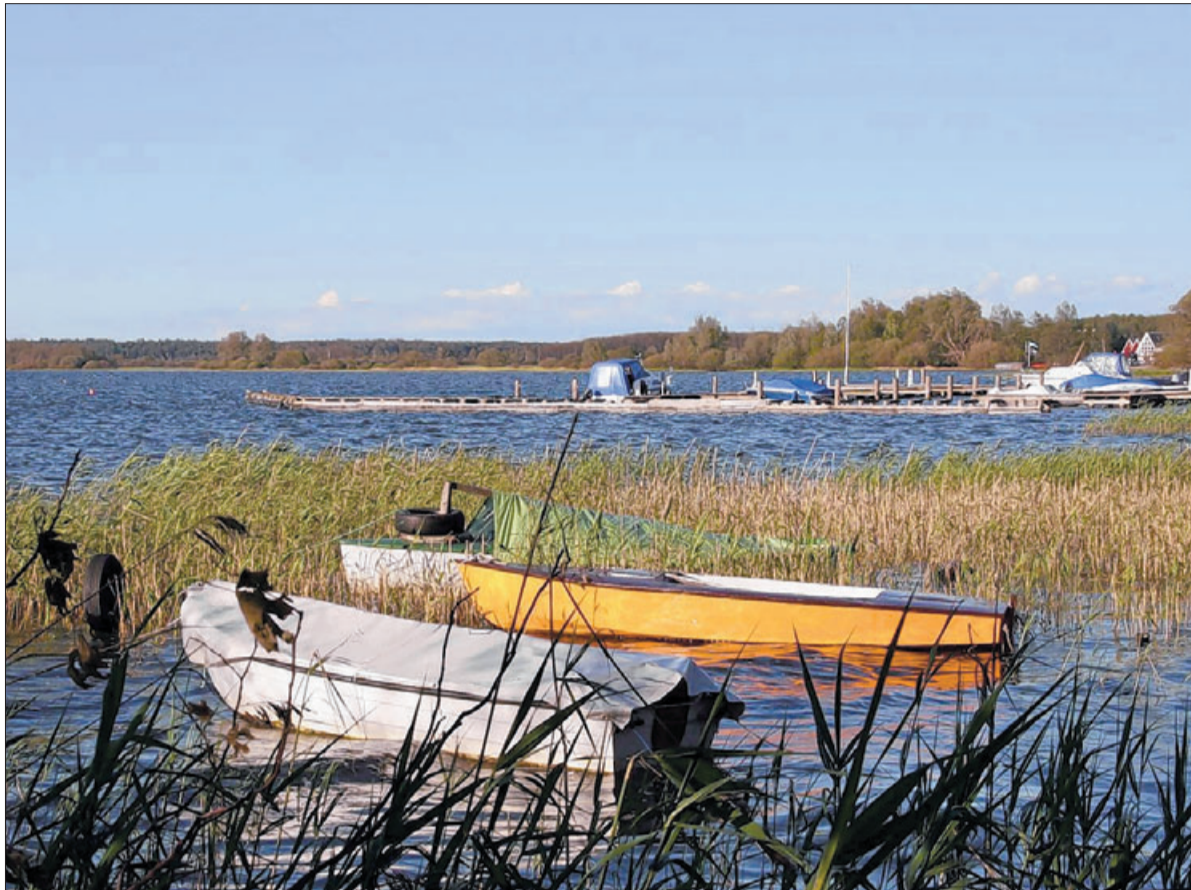
Spaziergänge stehen im Programm: Eine der Trauerreisen führt in die Mecklenburgischen Seenplatte.

„800.000 Menschen sterben pro Jahr in Deutschland“, rechnet Roth. „Trotzdem hat das Thema keine Lobby in der Öffentlichkeit.“ Der Reiseveranstalter TUI hat jetzt den Mut, dieses Nischenprodukt als Gruppenreise in sein Portfolio aufzunehmen. Trauer verarbeiten mit einem Veranstalter – eigentlich eine absurde Idee. „Ein ungewöhnliches